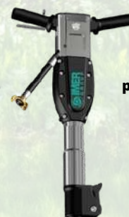
Brise béton pneumatique IMER A partir de