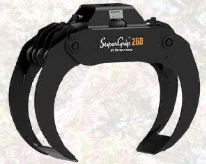
Grappin HULTINS A partir de 3045€