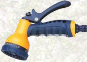
Pistolet d'arrosage avec pomme 7 jets 8,16€