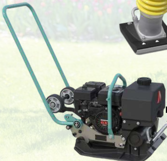
Plaque vibrante AMMANN APF1240BH