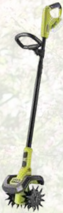
Bineuse RYOBI 18V RY18CVA Livrée nue 219€