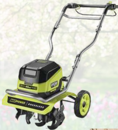
Motoculteur RYOBI 36V RY36CVXA-0 Livré nu 546€