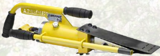
Coin d'abattage hydraulique NORDFOREST 1995€