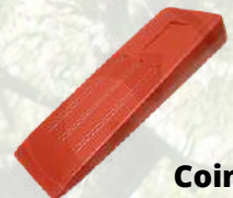
Coin en plastique 5,60€