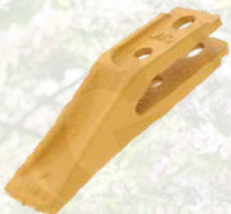
Dent de godet à boulonner A partir de 7,72€