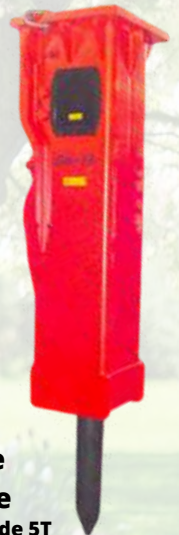
Brise roche hydraulique NPK PH2 pour pelle de 5T