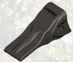
Dent de godet SMARTFIT A partir de 16€