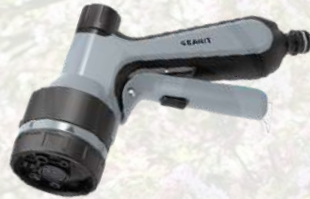
Pistolet d'arrosage multifonction 10,46€