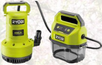
Pompe d'évacuation 18V ONE+TM livré sans batterie 203,99€