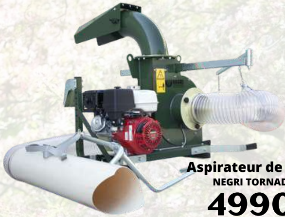
Aspirateur de feuilles NEGRI TORNADO T13