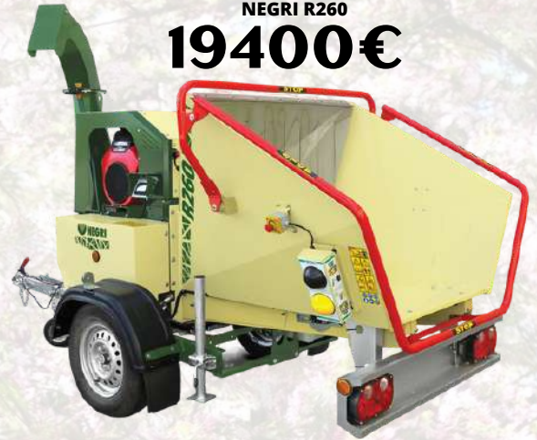
Broyeur de branches