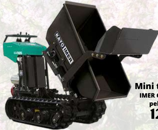
Mini transporteur IMER CARRY 105 avec pelle chargeuse 12348€