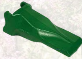
Dent de godet ESCO SUPER V A partir de 6,88€