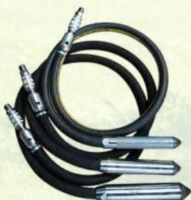
Aiguilles vibrantes pneumatiques IMER