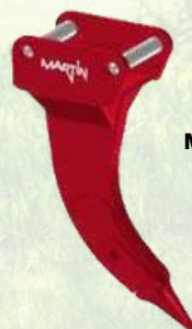
Dent de déroctage MARTIN pour pelle de 1 à 3T