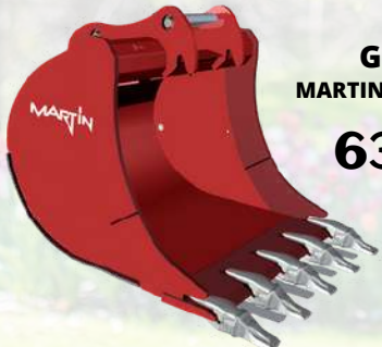
Godet MARTIN M03 300mm