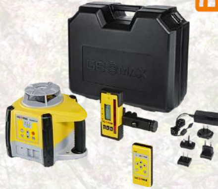
Laser multifonction GEOMAX Zone 60DG en pack