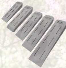
Jeux de coins en nylon 42€