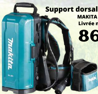
Support dorsal 4 batteries MAKITA 18V Livrée nue 866€