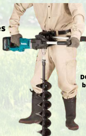
Tarière 40V 1350w MAKITA DG001GM105 livrée avec une batterie 40V et un chargeur rapide 997€