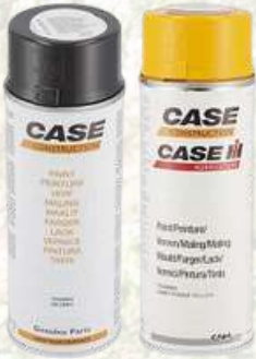
Peinture CASE aérosol 400 ml A partir de