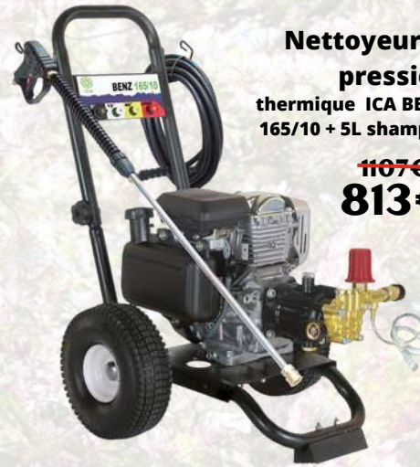
Nettoyeur haute pression thermique ICA BENZ HP BENZ 165/10 + 5L shampooing offert 1107€ 813€