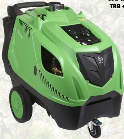
Nettoyeur haute pression eau chaude ICA PW-H 180/13 TRB +5L anticalcaire offert