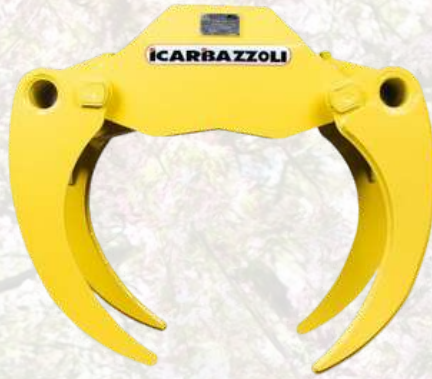
Grappin ICAR + Rotator A partir de 1995€