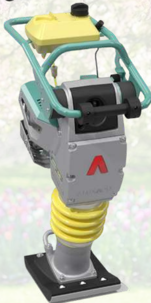
Pilonneuse AMMANN ATR 68 C 2385€