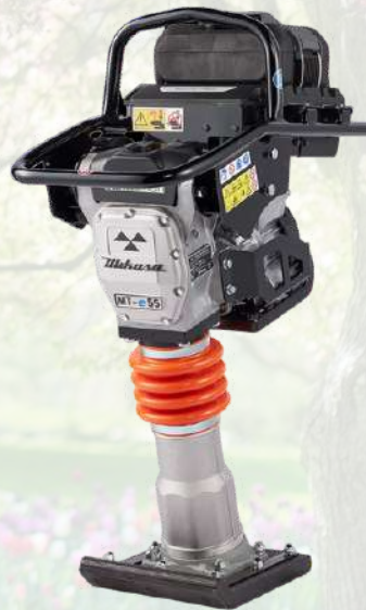
Pilonneuse électrique IMER MT-E55