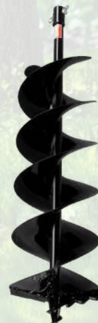
Mèche de tarière à deux hélices MAKITA A partir de 94€