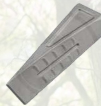
Coin vrillé en aluminium 33€