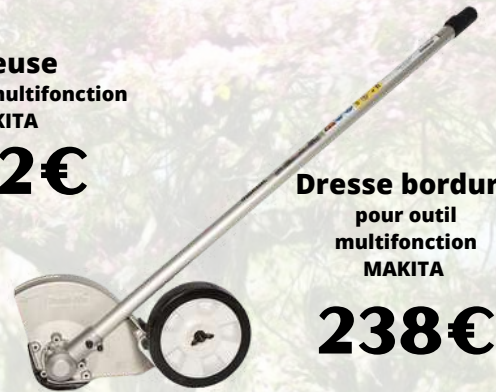
Dresse bordure pour outil multifonction MAKITA 238€