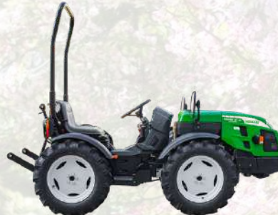
CROMO 35 AR MICRO