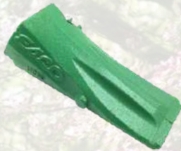
Dent de godet ESCO ULTRALOCK A partir de 62€