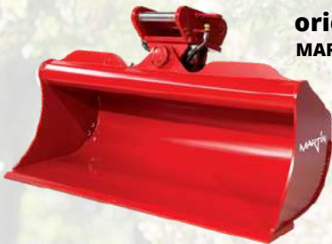
Godet de curage orientable 2,5 t MARTIN M03 850 mm