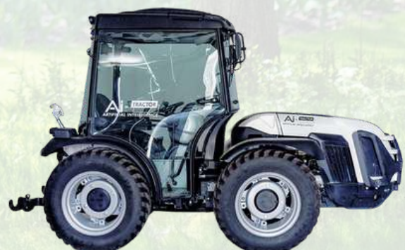
VEGA 85 AL-TRACTOR