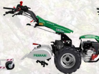
380 HY STARGATE