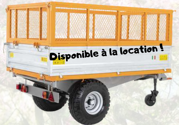
Benne paysagiste tribenne hydraulique