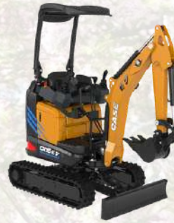
CX15EV Electrique !