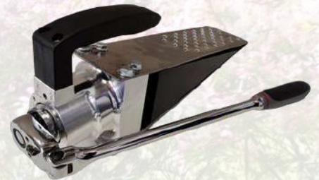
Coin d'abattage mécanique EDER 924€