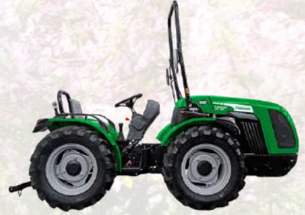
COBRAM 60 AR