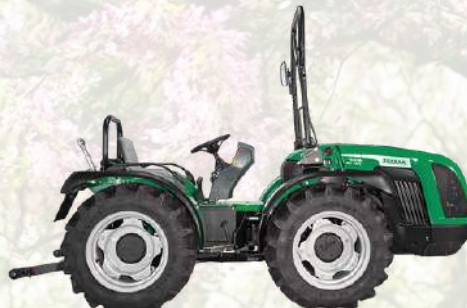
THOR 85 AR