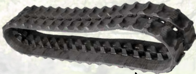
Paire de chenilles A partir de 210€