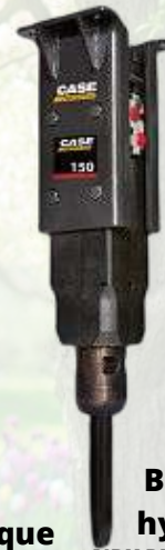
Brise roche hydraulique CASE HP150FS pour pelle de 0.7 à 3T