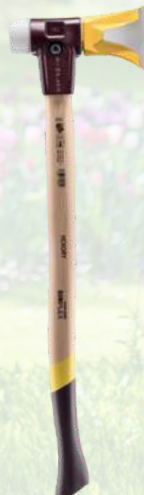
Hache à fendre HALDER SIMPLEX 128€