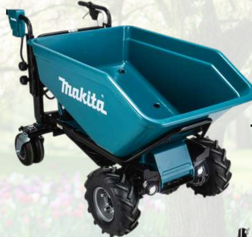
Transporteur MAKITA DCU603Z Livré nu TARIF A VENIR DISPO MARS 2023