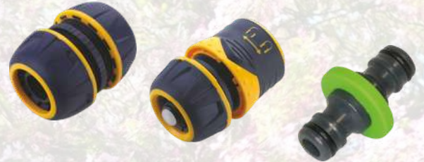
Raccords rapides / jonctions de tuyau A partir de 2,41€