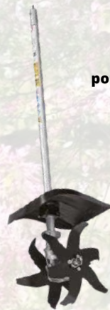
Bineuse pour outil multifonction MAKITA 362€