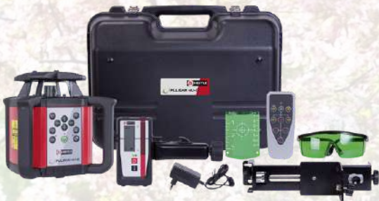
Laser multifonction NESTLE HV-R en pack 997€