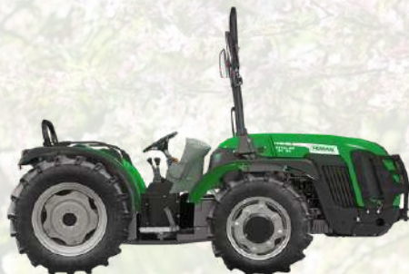
STELLAR 85 RS