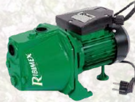
Pompe à eau de surface auto-amorçante 88€