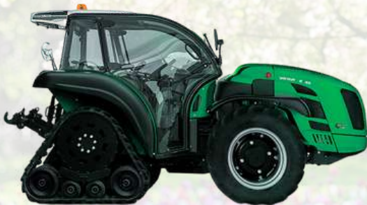
VEGA SKY JUMP K90