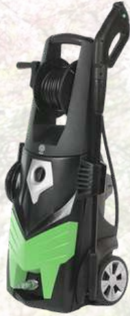
Nettoyeur haute pression PW 150/8 SAB XR + 5 L shampooing offert 546€ 379€