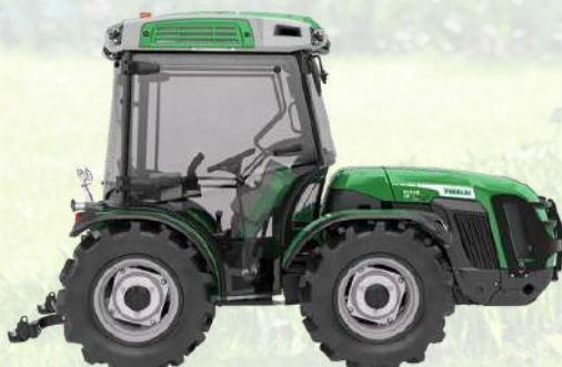
MIZAR 70 DUALSTEER