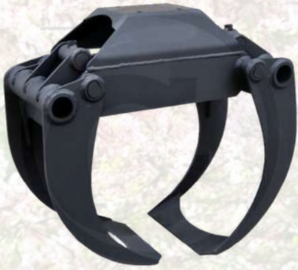
Grappin GMR A partir de 1500€