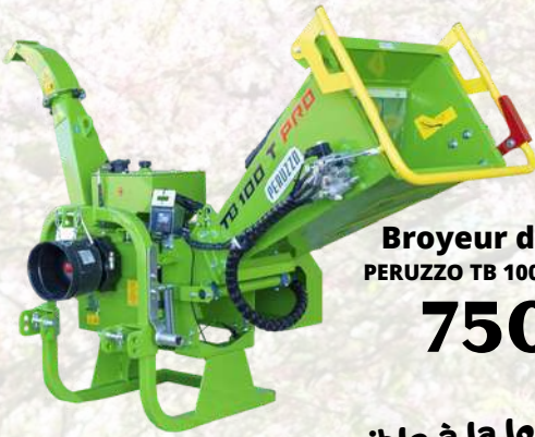
Broyeur de branches PERUZZO TB 100-T PROFESSIONAL